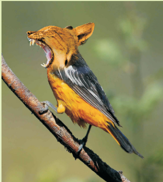
Keine Gentechnik im Oberallgäu