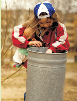
Wege aus der Alters- und Kinderarmut