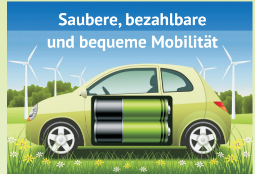
Saubere, bezahlbare und bequeme Mobilität Erneuerbare Energien sichern einen Know-How- und Technologiefortschritt für Deutschland