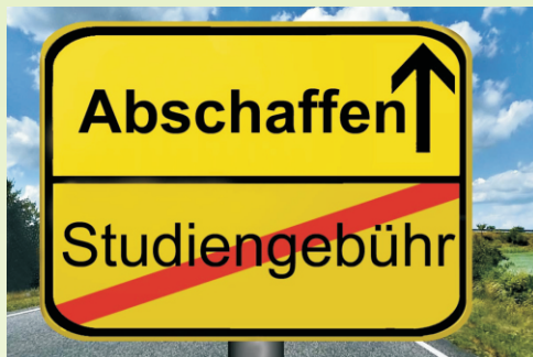
Abschaffung der Studiengebühren in Bayern