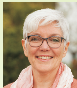
Unsere Direktkandidatin für den Bundestag