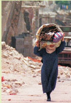
Bekämpfung von Fluchtursachen