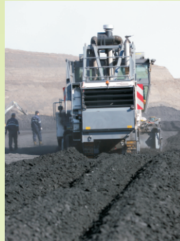
Zeitnahe Abkehr aus der Kohle