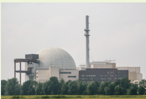
Ausstieg aus der Atomkraft