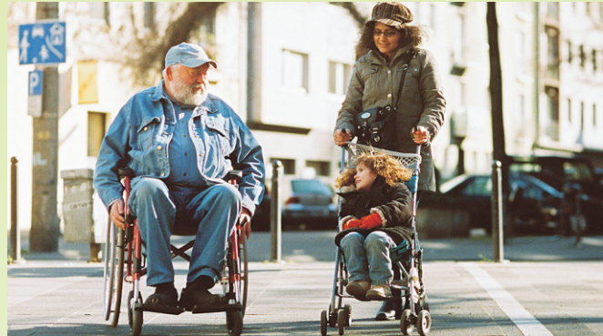
Inklusion als Gesellschaftsprojekt